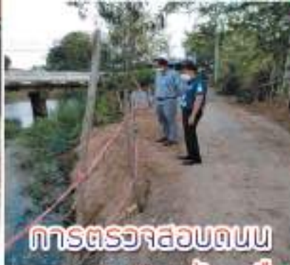
การตรวจสอบถนน