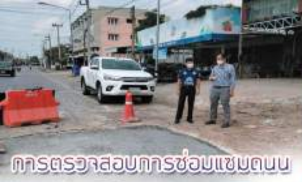
การตรวจสอบการซ่อมแซมถนน