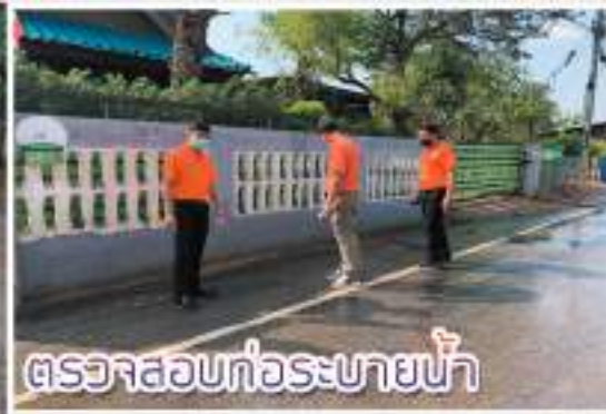
ตรวจสอบท่อระบายน้ำ