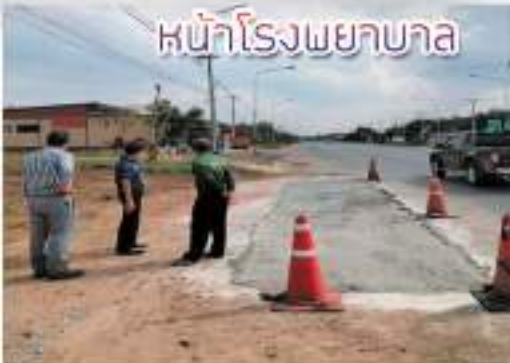
หน้าโรงพยาบาล