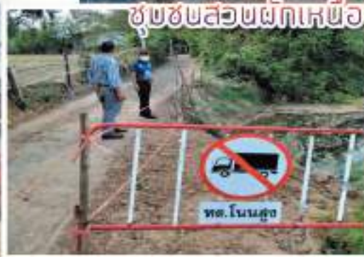
ชุมชนสวนผักเหนือ